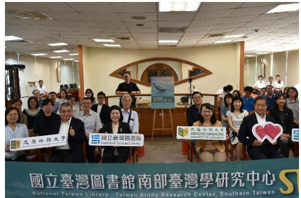
圖 2 「南部臺灣學研究中心」成立合影