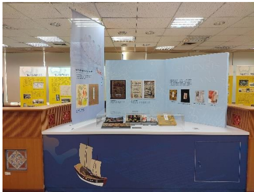
圖 3 中心展示空間呈現臺灣學主題內容