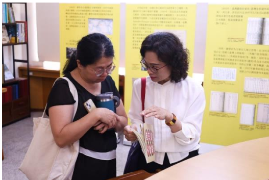
圖 5 國臺圖主任們於中心內討論臺灣學內容