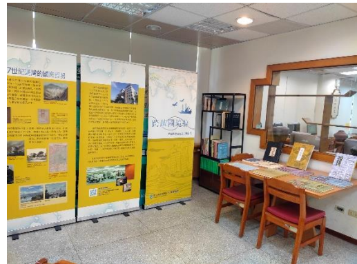
圖 4 中心閱讀與資料服務空間一隅