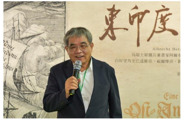
圖6 前教育部政務次長蔡清華教授致詞