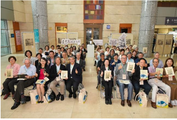
圖1 《東印度旅遊見聞》新書發表會合影