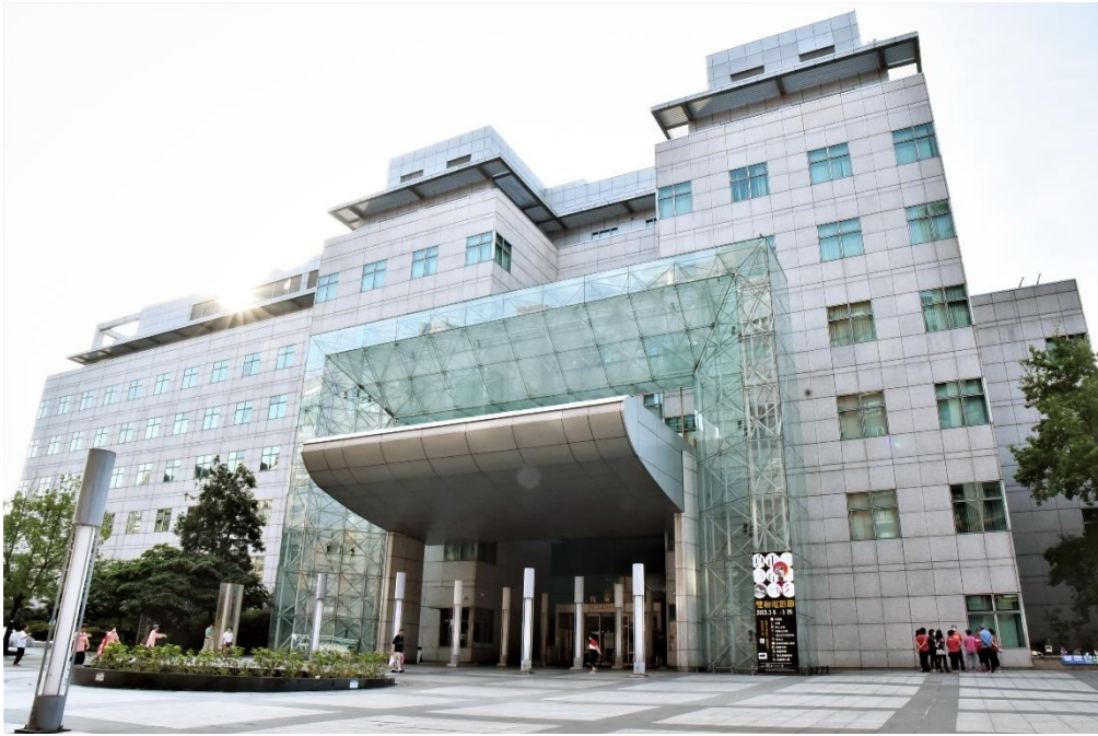
圖 1 國臺圖持續推動臺灣學與東南亞研究發展