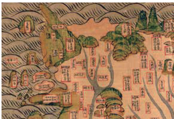
▲約 1689 年至 1722 年左右的基隆地圖，標註各地聚落地名。（資料來源／美國國會圖書館）

基隆原名雞籠，清雍正年間後成為市鎮，1875年更名為基隆。和平島在明初抄本《順風相送》記載中，標示為小琉球或小琉球頭，已是由福建—琉球國—日本航路必經之地；至晚明代中葉以後，小琉球頭改稱圭籠頭或雞籠山、雞籠。1567年海禁解除，中國人口壓力大，常有海商漁民到和平島營生，並有定居趨勢，貿易更通往日本。1626年西班牙占領和平島前，已有華商來此與巴賽人做生意，也有漢人定居。