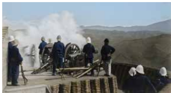
▲清法戰爭期間，法軍於基隆高地進行砲擊。（圖片提供／王子碩，出處／《彩繪福爾摩沙探險島：19世紀臺灣的歷史色彩》，2023年）

1883年，清法因越南主權問題開戰，法國希冀取得基隆煤礦為戰艦提供能源，以封鎖東南沿海，威脅中國沿海各大城市，也藉機占領臺灣，增加談判籌碼。清國得知法國企圖後，通令沿海各省加強武備，也了解臺灣的戰略地位重要，派欽差大臣兼福建巡撫劉銘傳前來督戰。1884年8月5日法國遠東艦隊副司令李士卑斯（Lespès）率領三艘戰艦進攻基隆，開啟西仔反戰爭基隆戰役。