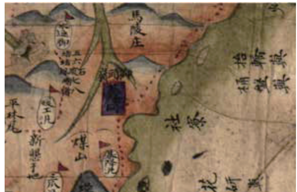
▶ 1879年〈臺灣前後山全圖〉標示基隆有「煤山」。