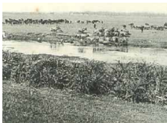
▲加禮宛牧場。（圖片出處／《臺灣拓殖畫帖》，1918年）

當時，總督府認為臺灣林地與平原上的荒地，只要釐清土地的權利關係，即可展開上述的種種殖產計畫。而「移