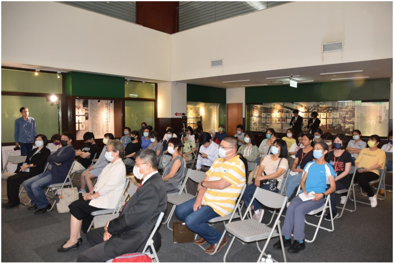
圖 4 知識的入場券特展開幕實況