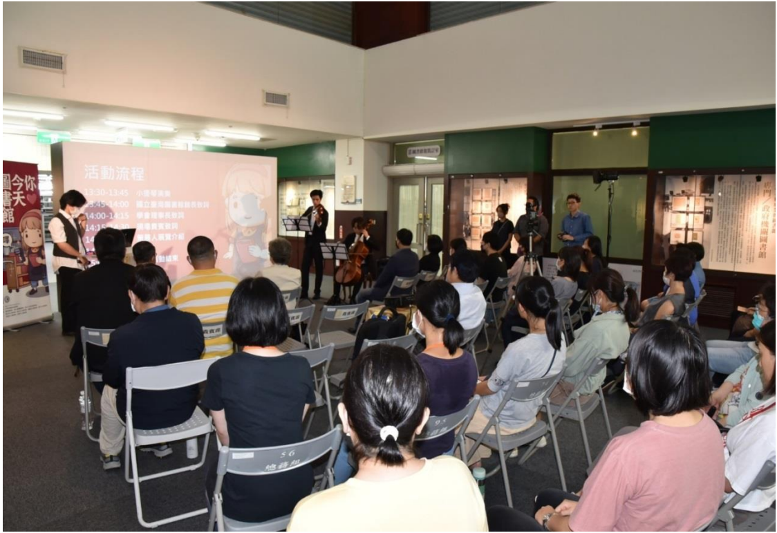
圖 2 知識的入場券—臺灣各級圖書館借書證/閱覽證特展開幕小提琴演奏