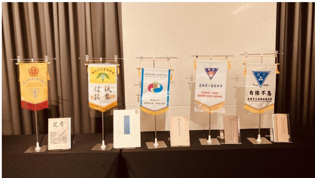
記者會場五校校旗與國臺圖贈送特藏複製本

國臺圖贈送五本珍貴文獻複製本除在今日記者會現場公開陳列展示外，並在國臺圖自建「日治時期圖書影像系統」資料庫中有完整數位化影像，有興趣的民眾可透過國臺圖網站首頁的「資源探索」項下「數位資源」瀏覽「臺灣學數位圖書館」各種資料庫。