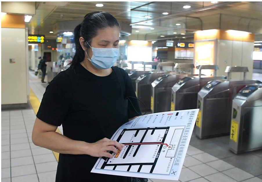
圖 1：視障者於臺北捷運永安市場站使用觸摸式地圖。

國立臺灣圖書館（以下簡稱國臺圖）製作自臺北捷運永安市場站往返國臺圖的觸摸式地圖，提升視障者往返圖書館便利性，助視障者獨立自主走出門。「觸摸式地圖」共製作兩幅，第一幅設置於臺北捷運永安市場站詢問處，第二幅設置於國臺圖視障資料中心服務櫃檯，歡迎視障朋友多加利用。