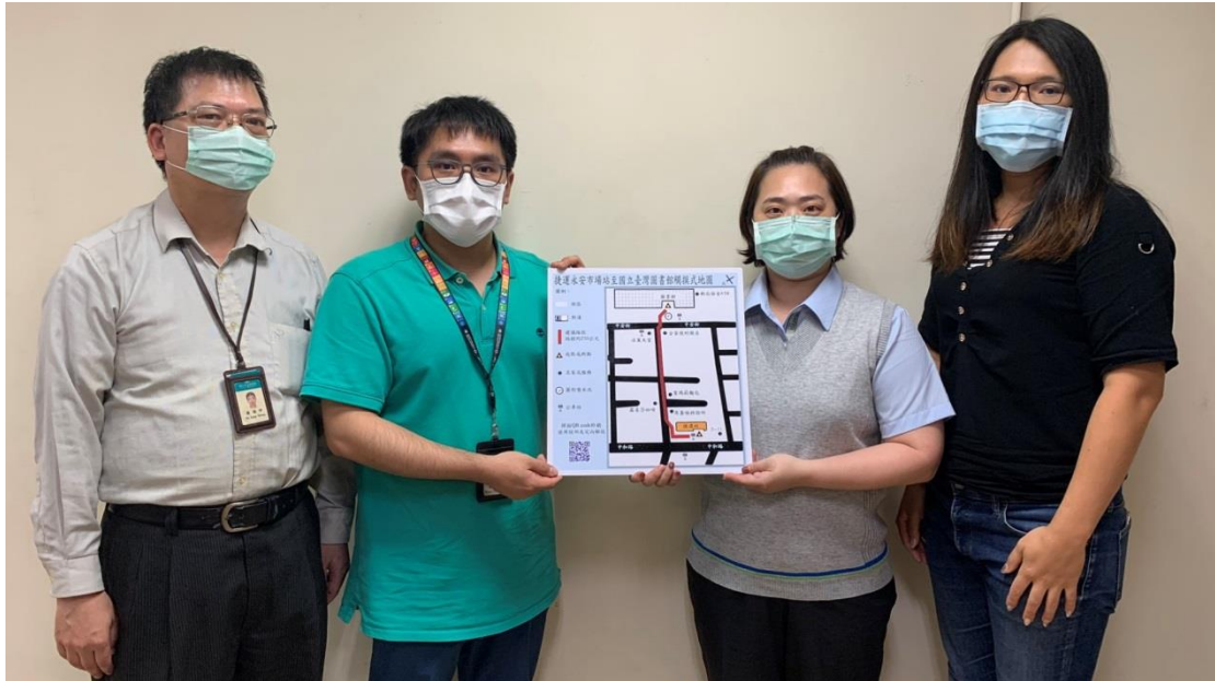
圖 4：觸摸式地圖移交予捷運永安市場站—服務正式啟用 左至右：國臺圖資訊中心蘇組長、國臺圖視障資料中心黃先生、 北捷永安市場站蔡站長、北捷站務處規劃課方小姐。