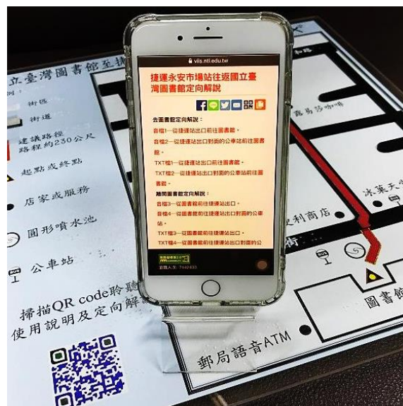
圖 3：視障者可運用智慧型手機或電腦上網聆聽路線導引定向解說

國臺圖持續提供多元便利、行無礙的到館輔助，除了觸摸式地圖，亦同步提供「專人導引服務」，歡迎未接受過定向行動訓練或不便獨自從捷運永安市場站往返圖書館的視障朋友多加利用，服務洽詢專線 (02)2926-1470，還等什麼呢？讓我們一起愛上圖書館吧！