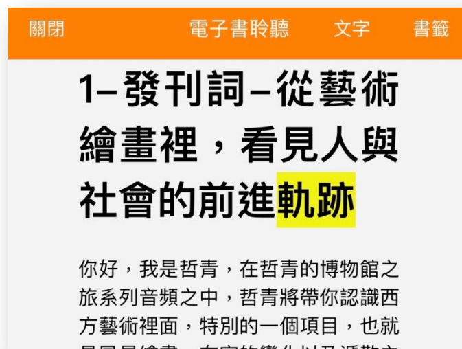
圖 2：EPUB 電子書「高亮標示文字功能」邊聽、邊看，協助學習障礙者閱讀 (圖為視障隨身聽 APP 電子書閱讀畫面截圖)