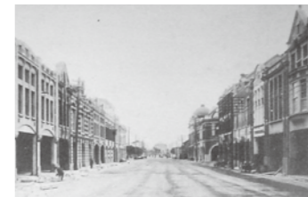
▲改築完成前後對比，府後三丁目府中五丁目往北看。