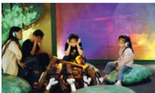
以錄音播出的方式，營造聽故事的情境，介紹原住民族相關神話。