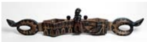
排灣族古樓社連杯，杯上雕有許多動物圖案。

【本刊訊】為讓民眾對台灣南島文化有更進一步的了解，國立台灣博物館目前正在舉行「聽·傳·說——台灣原住民與動物的故事」特展，營造聽故事的情境，以錄音播出的方式，介紹原住民族相關神話，包括布農族的黑熊的智慧、憤怒的百步蛇、邵族的白鹿傳奇等。