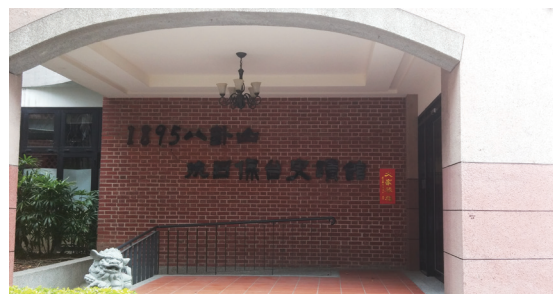
▲ 1895 八卦山抗日保臺史蹟館。

客家抗日義軍最終無力阻擋強大的日軍，但他們為保衛家園而浴血抗日的事蹟，至今仍在臺灣人的心中世代感念。☰