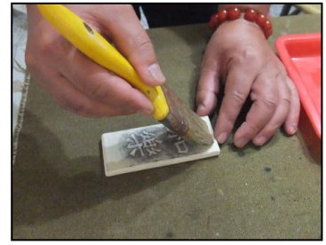
在碑上刷一層白芨水