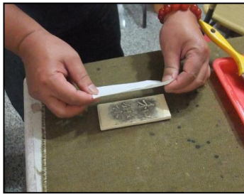
由上而下對齊上紙