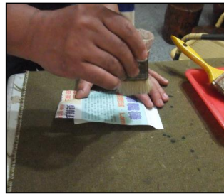
用棕刷敲打使字凹入