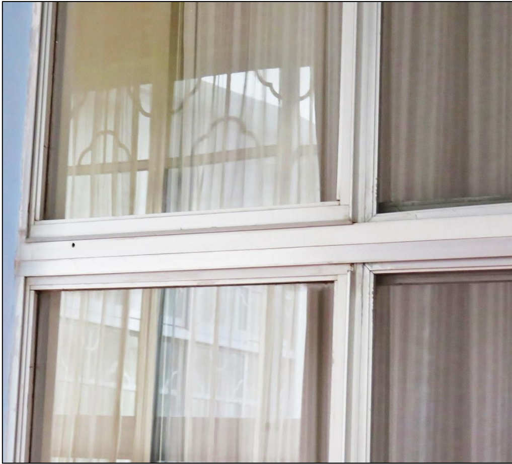
中山樓館內的鋁窗