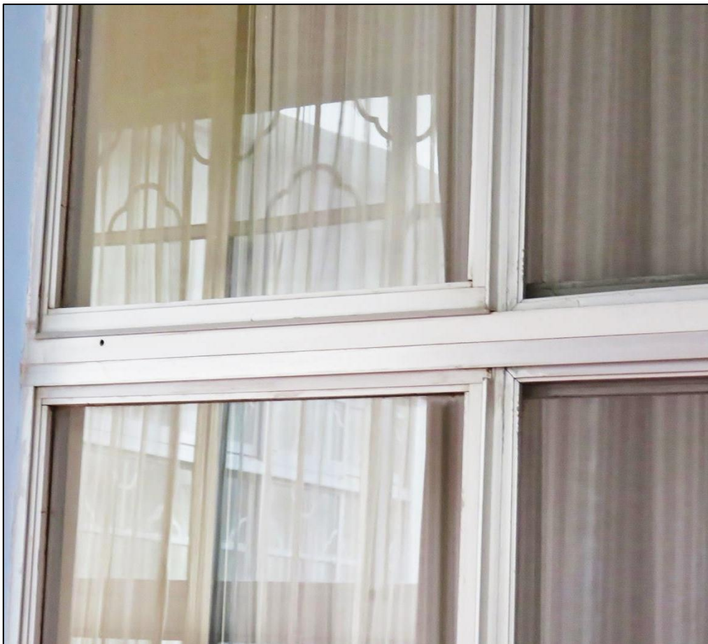
中山樓館內的鋁窗

隨著經濟起飛，臺北市由 20 萬突破成為 100 萬以上人口的院轄市等級，搭上推廣列車，從此發揚、流行全臺灣。