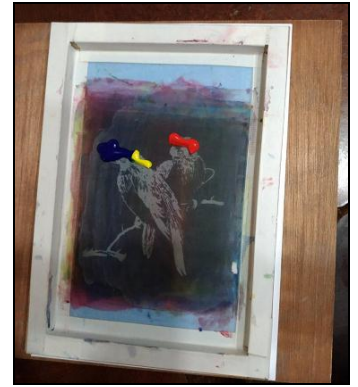
油墨倒入網屏上端