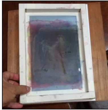
絹版與宣紙事先對齊