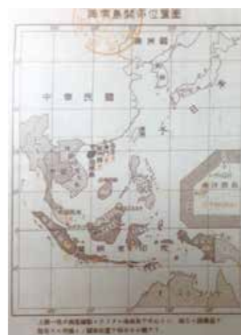
▲南海諸島關係位置圖。

1929年，受世界經濟不景氣影響，中止開發行為，撤回全部員工。日本政府將拉薩島磷礦株式會社在新南群島的經營情況，作為日本「發現先占」的依據，與法國進行交涉長島主權事宜。1939年3月30日，臺灣總督府宣布將新南群島併入高雄州高雄市。6月，新南群島調查團將高雄市尹宗藤大陸的「高雄州高雄市新南群島」碑立