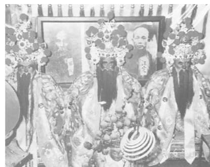
▲忠烈廟正殿內服祀余清芳（中央）、江定（正片）、羅俊（倒片）三位元帥的金身。

值得一提的是，在研讀資料過程中，從臺灣省文獻委員會編著的《余清芳抗日革命案全檔》，以及程大學編著的《臺灣先賢先烈專輯：余清芳傳》等史料中，可以看出此一抗日事件的參與者除了臺中、臺北的居民外，以臺南、高雄附近的靠山區住居多，而這些地方大多是平埔族部落，因此一般史料多記載此戰役是「漢人