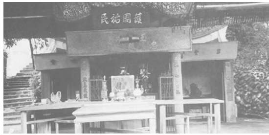
▲玉井國小邊，供奉余清芳、江定、羅俊等抗日先烈的忠烈廟。

1997年，在一次推廣臺語文學的活動中，筆者有緣接觸到「臺灣念歌」這門傳統藝術，決心把它傳承下來，於是跟隨吳天羅、朱丁順兩位老師學習臺灣念歌和恆春民謠的月琴彈唱。開始學習後，深感要傳承臺灣念歌，不應以傳唱傳統的歌仔為滿足，便以「創作自己的歌」為努力的目標；又思考臺灣人被殖民者壟斷了歷史解釋權，決心以臺灣歷史事件作為書寫題材，採臺灣庶民的觀點，用念歌方式「唱自己的歷史」，詮釋自我的歷史。後來，經蒐集資料、閱讀、內化、創作，2001年終於完成第一本長篇創作歌仔：《臺語七字仔白話史詩——義戰噍吧哞》一書。