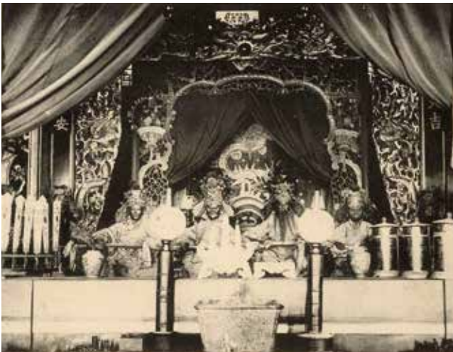
▲西來庵主祀五瘟神等神明。

1915年，西來庵·噍吧哖事件的發生，震驚了日本統治者。當時的日本內務大臣一木喜德郎稱這次的事件是「一部分的無智迷信之輩」所惹出的事端。為何他會以「無智迷信」來形容余清芳等人呢？