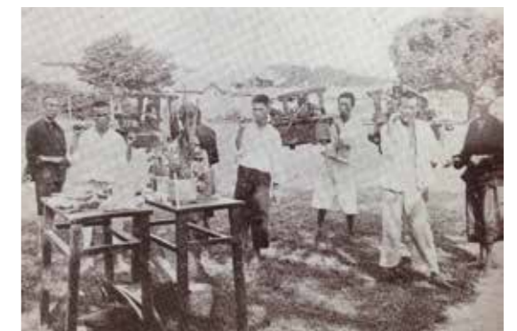
▲民間信仰中神明降駕儀式。