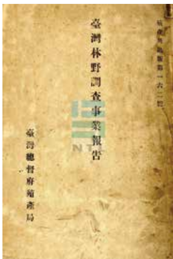
▲《臺灣林野調查事業報告》。