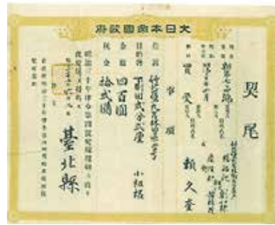
▲日治初期仍延續清時舊有土地制度，從契尾中可見小租權之紀錄。