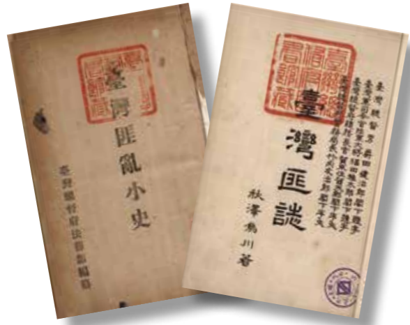
▲《臺灣匪亂小史》、《臺灣匪誌》。

1920 年，臺灣總督府法務部編纂出版了《臺灣匪亂小史》，作者應為秋澤次郎。一開始論及臺灣人族群分布及宗教信仰的情形，日本在取得臺灣之後，祭出「匪徒刑罰令」來抑制臺灣各地的抗日群眾。接著，開始論述 1895 年以後各地抗日的情形。由於初期抗日事件極多，事件之間多有連續發生者，有限的篇幅中難以詳述，故 1895 年至 1907 年北埔事件以前臺灣民眾抗日的情形僅能略述，北埔事件以後的武裝抗日事件則篇幅較大，包含 1912 年的林杞埔事件、土庫事件、苗栗事件、1914 年的六甲事件，以及 1915 年的西來庵（噍吧哖）事件，其中又以西來庵事件所占篇幅最大，占去本書篇幅的一半左右。