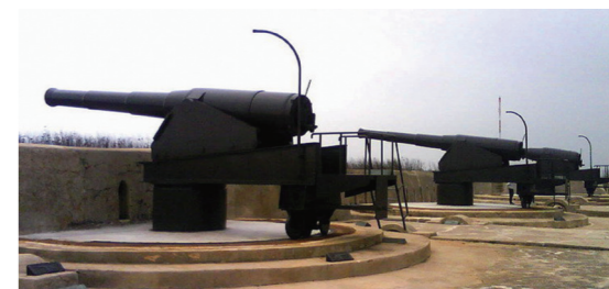
▲澎湖縣政府在澎湖各炮臺依清朝時的布置，設置複製的三尊阿姆斯特朗後膛炮。

3 月 24 日日軍連續攻克大城北炮臺、東城炮臺、金龜頭炮臺，旋進占媽宮城。不過西嶼東、西炮臺反擊甚烈，對於甫占領廳城的日軍來說是一大威脅。原本日軍想渡海進攻這兩座炮臺，不料 25 日下午守軍自轟兩座炮臺逃逸，整個澎湖戰役終告結束。澎湖炮臺群的建設是參考清法戰爭經驗所致，當時法軍從蔴裡登陸、艦隊硬闖澎湖灣，故建省後清廷認為守住媽宮西側自能以逸待勞。孰料日軍從守備最弱的東側入侵，炮臺群中最強的火力無法制敵種下敗因。有意思的是，守軍除了炮臺防禦外，原本也想部署水雷克敵。可是日軍占領澎湖後進行搜海作業，提到所屬海域都沒有發現水雷。爾後經過一個月的折衝後，1895 年 4 月 17 日李鴻章與日方簽訂《馬關條約》，允許割讓臺灣全島、澎湖群島予日本。清代澎湖的歷史發展，至此畫下句點。☞