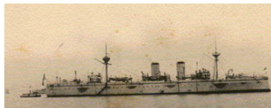
▲澎湖島占領之役日艦主要戰艦—秋津洲。

東半島，延伸至東南沿海。1895 年 3 月 23 日上午日艦初犯大城北，該處炮臺開炮還擊，下午日軍趁隙在裡正角登岸。