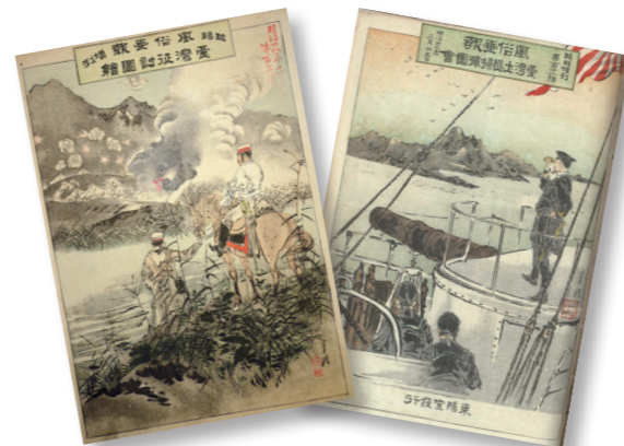
▲《風俗畫報·臺灣征討圖繪》第 103 號。 ▲《臺灣土匪掃攘圖會》第 111 號。

談到乙未見聞，除了北白川宮能久親王之外，還有大量的戰況紀錄，其中，《風俗畫報》臨時增刊《臺灣征討圖繪》一系列出版品尤其引人注目。它們是由東京東陽堂出版，根據學者吳密察之研究，《風俗畫報》於 1889 年 2 月至 1916 年 3 月間發行，它的發行目的係因明治維新以後，日本快