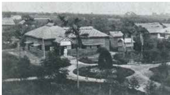
▲吉野村移民指導所。

礙於東臺灣投資環境局限，內地資本雄厚的大企業對開發東部興趣缺缺；而在總督府鼓勵會社私營東部移墾的背景下，東臺灣產業開發與地方建設，有賴這些在地實業家的活躍與持續經營。