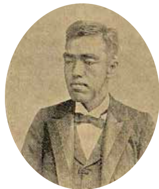
▲賀田金三郎。

賀田金三郎（1857年－1922年），日本山口縣人，1895年以大倉組臺灣總支配人身分來臺，而後設立驛傳社、賀田組等，於臺灣從事移民、土地開墾、土木建築、製糖、製腦、製冰、礦業、金融等多方面活動。