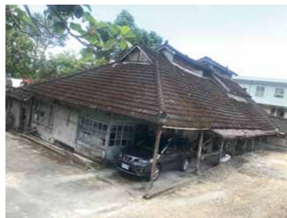
▲花蓮縣瑞穗鄉的菸樓。(攝影／黃雯娟，2020年6月)

1905年，臺灣總督府實施菸草專賣制度；1913年，專賣局在吉野村試種黃色種菸草成功，並逐步擴增到豐田、林田等移民村種植。為了配合專賣局黃色種菸草增產計畫，1933年設立瑞穗移民