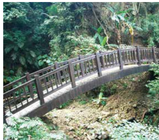
▲浸水營道路上新修築的橋梁。