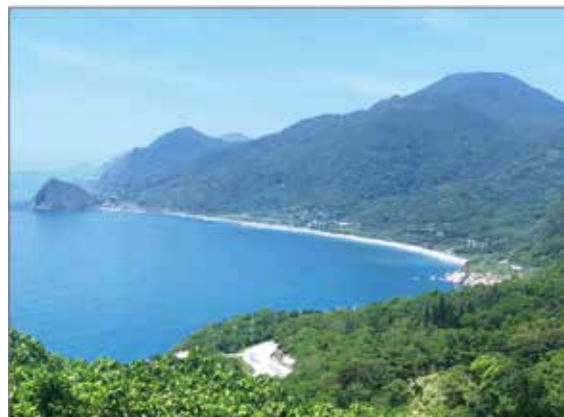
▲撒奇萊雅族南遷的聚落—磯崎。

欲開鑿水尾沿秀姑巒溪東至大港口的道路，以資轉運。但遭烏漏社、奇密社、阿綿社、納納社等各社反對，群起反抗；1877年，各社起而攻擊營壘，抵抗來襲清軍，經清軍合力進攻方才壓制，清軍為免除後患，趁各社歸降之際閉門殺俘，徹底消滅各社勢力，因而完全控制後山中路。