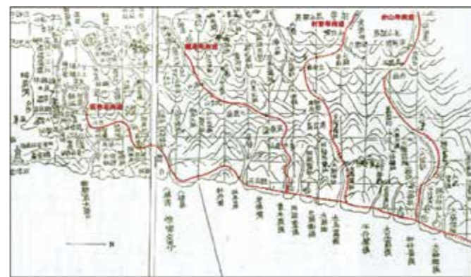
▲開山撫番時期所開南路路線圖（部分，紅線為作者所繪）。（資料來源／夏獻綸，《臺灣輿圖·後山總圖》）

欽差大臣沈葆楨抵臺後，兵力的部署主要以防堵監控為主，並未出兵攻擊。日方以臺灣山地不屬清政府管轄作為出兵藉口，並在東臺灣進行一系列探測行動，清政府產生警覺。清政府放棄封山禁令，改行開山撫番政策，企圖將