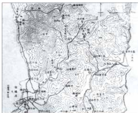
▲牡丹社與鄰近各社分布圖（局部）。（資料來源／西鄉都督樺山總督紀念事業出版委員會，《西鄉都督と樺山總督》，1936年出版）

中央山脈東側山地： 太魯閣族分布於和平溪、立霧溪、三棧溪、木瓜溪與清水河流域之山區。布農族分布於太平溪、拉庫拉庫溪、新武呂溪與內本鹿溪流域之間。魯凱族分布於大南溪流域中下游。排灣族則分布於太麻里溪、金崙溪、大竹溪至大武溪之間。