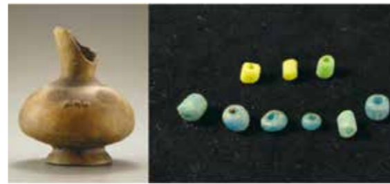
▲花岡山遺址上層文化出土的黑色陶器和玻璃珠。