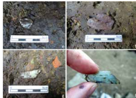
▲月眉II遺址出土最早製造玉器的證據。

新石器時代晚期： 距今3,400年至2,400年，有三個大的文化體系：一是卑南文化，分布縱谷中段、海岸南段以南，直到恆春半島，聚落大型，人口眾多，社會組織嚴密；墓葬以石板棺為主，擁有豐富陪葬品。其次是麒麟文化，分布海岸山脈東側中段，以不同形式巨石作為宗教崇拜，生業形態和卑南文化相近，多運用海岸、海域資源；三是花岡山文化，分布縱谷、海岸山脈東側北段，以及奇萊平原，鄰近閃玉產地，承