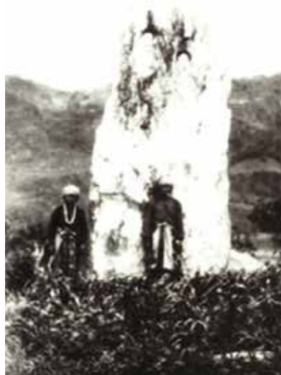
▲ 1896年鳥居龍藏首次記錄卑南遺址。

1925年，鹿野忠雄來臺就讀臺北高等高校，大規模調查臺灣的自然、原住民族及考古遺址，相關學科知識因而有長足進展。1928年臺北帝國大學成立，包