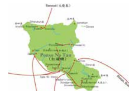
▲圖 3：蘭嶼島上人群之多元組成。(臺灣高砂族系統所屬的研究，1935)

近日有關連鎖便利商店進駐蘭嶼一事，引發正反兩方爭論。所有事物都有表面與裡面。文化是透過生活的實踐，存續與發展並變遷。 Tao 是否已準備好？接納「便利」商店的同時，勢必同時將其背後的資本主義消費邏輯納入其生活實踐之中，並逐漸成為當代 Tao 社會文化的一部分！