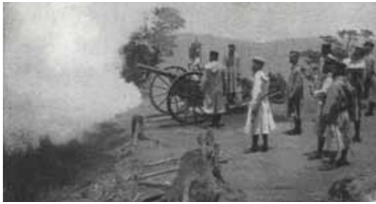
▲砲擊原住民居住地的「理蕃」。

月，即「五年計畫理蕃事業」實施期。「理蕃總督」佐久間左馬太對理蕃事業高度重視，他委任曾於1906年鎮壓太魯閣蕃「威里事件」的大津麟平策劃理蕃事務，大津沿用隘勇線圍堵政策，主張對太魯閣蕃採取嚴厲制裁，並加強軍警的取締功能，兼施以蕃制蕃、埋設地雷等。佐久間總督的五年計畫共有兩次，第一次是從1907年起，以甘諾政策的軟硬兼施、威脅利誘手段為主，但招致反抗，遂於1910年推出另一個以軍警圍剿的五年理蕃計畫，太魯閣族等尚未降伏的北蕃，就成為日軍率先討伐的對象。