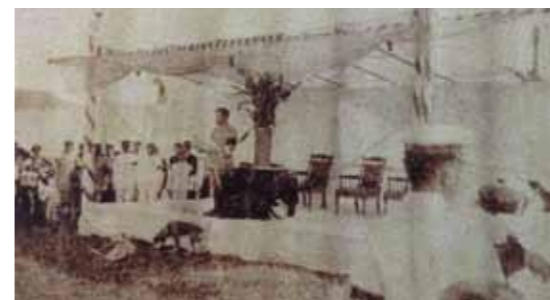
▲日軍討伐太魯閣蕃後歸來。

1918年至1941年間，日本當局對太魯閣族人進行大規模的集團移住，強迫部落移住平地，除方便控制外，更有利於山地資源開發與文明同化。日人致力於部落教化工作，在各駐在所設立蕃童教育所。鼓勵發展定耕農業，設置蠶業指導所、芋麻指導所、菸草耕作指導所及農業講習所。為徹底改變太魯閣族傳統經濟生活，