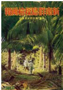
▲《新南群島探檢畫報》封面，大阪每日新聞社，1934年。