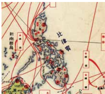
▲南洋興發事業地圖上，標示新南群島物產為磷礦。

日本農學博士恒藤規隆曾發現南沙許多島嶼都有海鳥糞，可供開採磷礦，1920年，拉薩島磷礦株式會社派員到南沙群島探勘，發現十一個島中有七個島都有磷礦，尤其以長島（今太平島）最豐富。從1918年起至1924年，拉薩島會社先後三次組成調查團，在南沙群島勘查十一個島；1926年後，將南沙諸島稱為「新南群島」，意為日本最南的新領土，希望日本外務省、海軍能將這些島