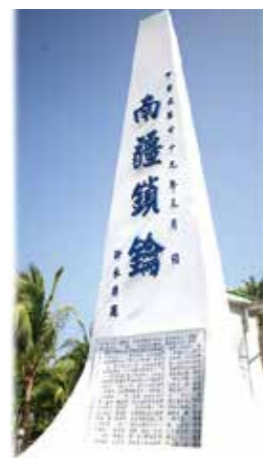
▲「南疆鎖鑰」碑。

太平島是我國南海海域強敵環伺之下的疆土，面積雖小但主權明確；島上除防禦工事，還有生態保育區，保護綠蠵龜的產卵棲地。