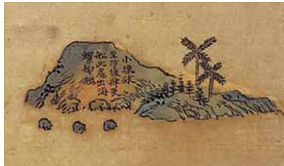
▲乾隆古輿圖中的小琉球。

兵相助，推測當時已有不少人因捕魚採集陸續搭寮居住。此事件可能導致小琉球遭官方封禁。