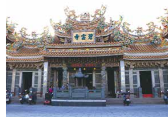
▲小琉球公廟碧雲寺。

具公廟性質的大寮碧雲寺是小琉球第一座開基寺廟，也具體證明大寮是小琉球最早發展成聚落的地方；另一座公廟三隆宮稍晚於碧雲寺開基，建廟地點亦在大寮，自1927年遷往白沙尾後，逐漸取得嶼民認同，成為日後獨立舉辦迎王的中心。此一變化，主要與日治時代漁業技術的現代化有重要的關聯。