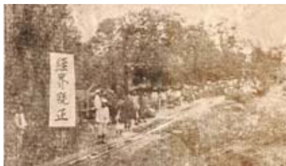
▲民眾歡送土地調查派出所所員時之情景。

具體而言，外業調查工作首先必須釐定堡界、庄界，即在各街庄業主代表（委員）的協同下，製作街庄略圖，並據此收受街庄內各業主提出之《土地申告書》制式表格，以及足以證明土地權利之證據書