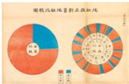
▲地租改正之新舊地租比較圖。

明治 28 年（1895），日本根據馬關條約取得臺灣，為尋求這個海外第一個殖民地的財政自立，殖民政府隨即展開各項賦稅來源調查，發現臺灣的錢糧賦稅較日本內地為低，且各地的魚鱗圖冊也多毀於兵燹，田賦制度紊亂，實有必要儘速展開土地調查與田賦改革。