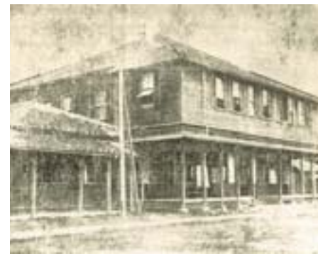
▲臨時臺灣土地調查局。

時完成地籍圖（庄圖）和地形圖（堡圖）的繪製，但是若要製作包含數十街庄的堡圖，則需要表示一堡內各地關係的圖根，因此必須實施三角測量。又因日本在琉球縣的土地整理事業中已有進行三角測量的先例，如此的經驗或許成為臨時臺灣土地調查局決定展開全面性三角測量工作的重要借鏡。因此，當局決定於明治 33 年（1900）7 月起施行三角測量，即以臺中公園內主三等三角點 89 號為測量基點，派遣圖根測量員在臺灣各地實施略等於三等三角測量精度的三角測量及設置三角點，並以三角測量點為基準，實施圖根測量，設定圖根點，作成 1/12000「圖根略圖」。接著，細部測量員進一步依據「圖根略圖」及「概況圖」，踏查土地形態，同時進行每筆土地的測量，以土名為區域單位調製比例尺為 1/1200 的「原圖」（市街地為 1/600）；「原圖」完成後，用透明紙複寫方式，繪出連接「原圖」的「連絡圖」。待土地測量結束後，復將「連絡圖」轉繪成