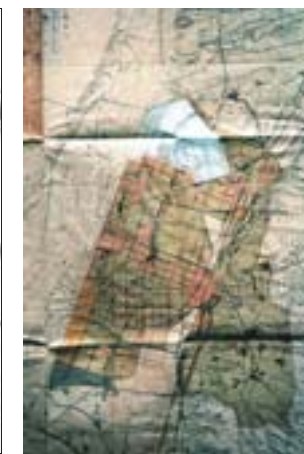
▲圖二：新高港都市計畫土地使用分區圖。