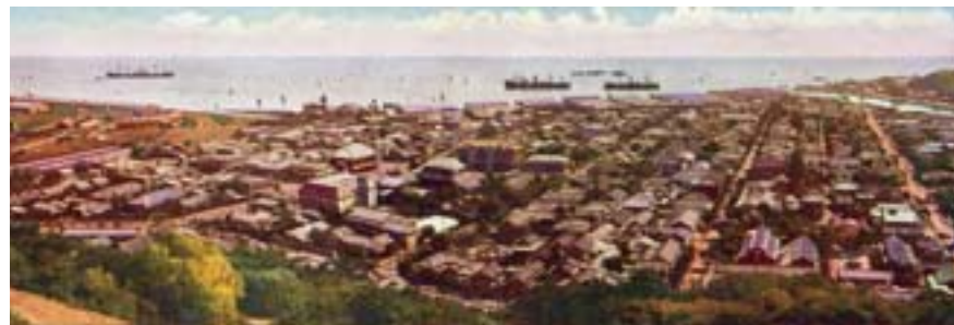
▲日治時期的高雄市全景。

令，不能違反實施在臺灣的日本「民法」、「登錄稅法」、「不動產登記法」等，所以以勅令「都市計畫關係民法等特例」來彌補以律令不能制定的事項。至此，相較於日本本土「都市計畫法」實施已晚17年，也比立法起草較晚的朝鮮總督府，於1934年6月所公布的「朝鮮市街地計畫令」晚了2年多。