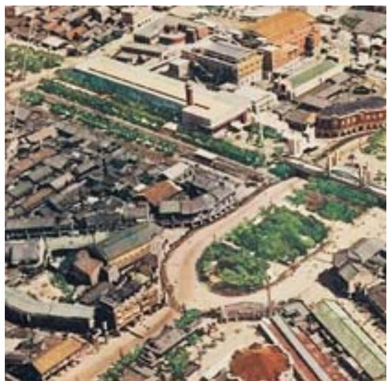
▲日治時期的建築法令影響現在的都市發展。圖為日治時期的臺北城景觀。

日治時期臺灣總督府於1936年公布的「臺灣都市計畫令」，為融合今日「都市計畫法」、「建築法」及「土地法」三法合成一體的法令，也是影響當前臺灣都市發展、建築風貌與土地使用深遠的日治時期重要基本法令。從臺灣都市計畫令建制歷程，可窺探臺灣都市計畫的誕生時代背景，也可了解臺灣建築與城鄉發展的演變影響因素。