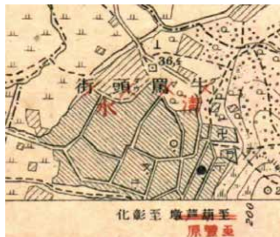
▲大正版《臺灣堡圖》以紅字加註新地名。

以北稱為堡；東臺灣稱為鄉；澎湖稱為澳。日治以後，堡里失去行政區域功能，但仍作為地名使用，直到1920年正式廢止。不過，有些街庄繼承堡里的名稱，尤以臺南地區為多：如永寧、仁德、歸仁、永康、新化、安定、善化等這些深具儒家精神的名稱都是。同時，街庄役場所在的塗庫改名仁德，埔姜頭改名永康，大目降改名新化，直加弄改名安定，灣裡改名善化。