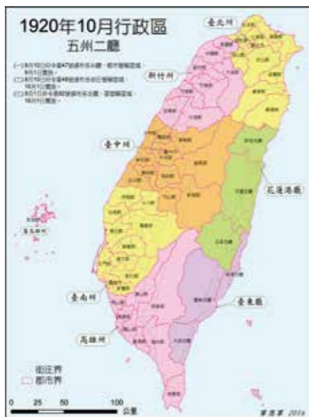
▲臺灣多數鄉、鎮、區仍沿用1920年制訂的名稱。圖為1920年地方制度改正圖。（圖片提供／葉高華）

之地名簡化，並作為街庄名。除了前面提到的筆畫縮減原則外，大部分是由三字刪為兩字。包括：槓仔寮→貢寮、頂雙溪→雙溪、冬瓜山→冬山、坪林尾→坪林、鶯歌石→鶯歌、紅毛港→紅毛（今新豐鄉）、大湖口→湖口、安平鎮→平鎮、楊梅壠→楊梅、石觀音→觀音、蘆竹厝→蘆竹、八塊厝→八塊（今八德區）、龍潭陂