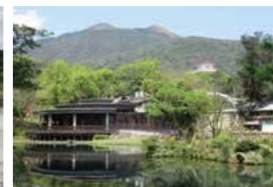
▲前山公園，在大屯山公園設計上為民眾利用的核心區域。