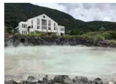
▲中山樓前的牛奶池。

大屯山公園的設計，約在1930年前後完成草山眾樂園與竹子湖休息所（竹子山莊），後因戰爭爆發及經濟因素而停擺，不過本多靜六在大屯山的調查成為日後劃設成國家公園的關鍵。對照地圖可發現，設計圖中所標示的硫氣孔，應是現存於中山樓前的牛奶池，而公園林則為前山公園，讀者有機會不妨上山走走，在現今的風景裡，重拾對歷史的想像。☞