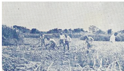
▲臺灣農業義勇團新竹州隊的耕種情形（上圖）；義勇團團旗（左圖）。

中日戰爭初始，日本陸續占領上海、南京、徐州、安慶、武漢等地，但國民政府在被占領區採取焦土政策，驅離農民，使得日軍無法在占領區取得物資，支援快速移動的軍隊。1938年，中支派遣軍決定在現地生產糧食、蔬果，以解決日軍的補給問題，要求臺灣總督府協助。