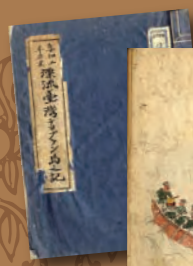
《享和三年癸亥漂流臺灣チヨブラン嶋之記》