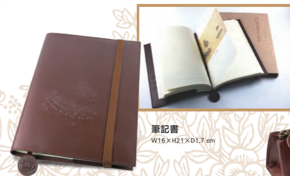
筆記書 W16×H21×D1.7 cm