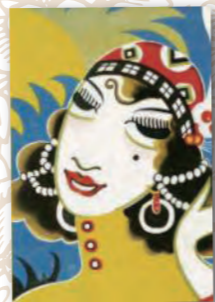
女性系列筆記書 W12.8×H18.7×D1.3 cm