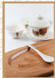
茶具組 - 茶盤×1 - 蓋杯×1 - 飲杯×2 - 茶匙×1 包裝W32×H18×D16 cm