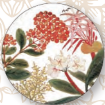
陶瓷吸水杯墊/花 直徑17 cm