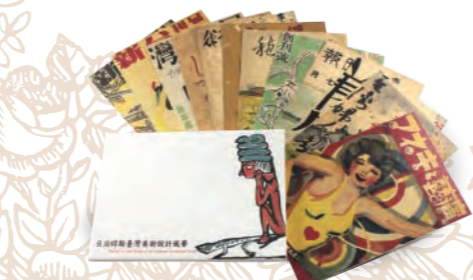
日治時期臺灣美術設計風華明信片 一組共12張，單張10×15 cm