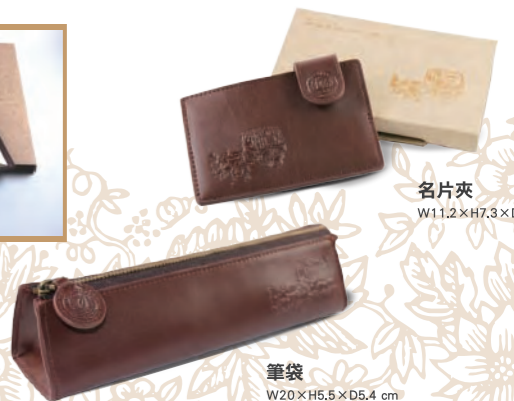
名片夾 W11.2×H7.3×D0.3 cm