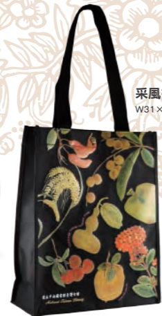
采風書袋 W31×H37×D10.5 cm