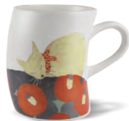
馬克杯/貓 430ml 直徑8×H11 cm