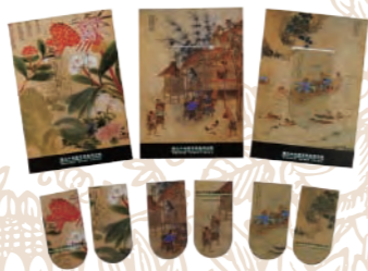
磁性書籤/渡溪、春米、花 8×11.3 cm