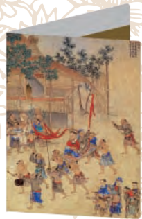
采風卷宗夾 W24×H31 cm