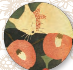
陶瓷吸水杯墊/貓 直徑17 cm