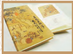
采風小札 W13×H22×D2 cm