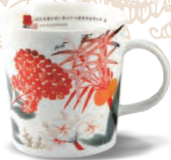
馬克杯/花 375ml 直徑9×H11.5 cm