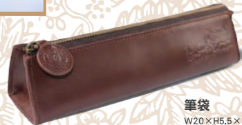
筆袋 W20×H5.5×D5.4 cm